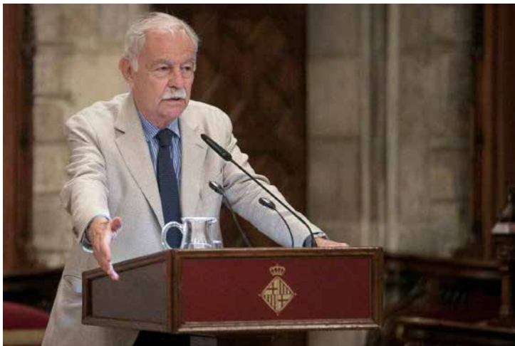
El escritor Eduardo Mendoza en el discurso inaugural.

* Con información de La Lectora Futura y Carlos Garfella/ El País