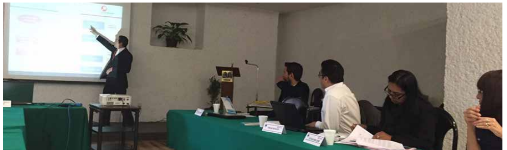
Una vez redactados los estándares se presentan al Comité Técnico del CONOCER para su aprobación.