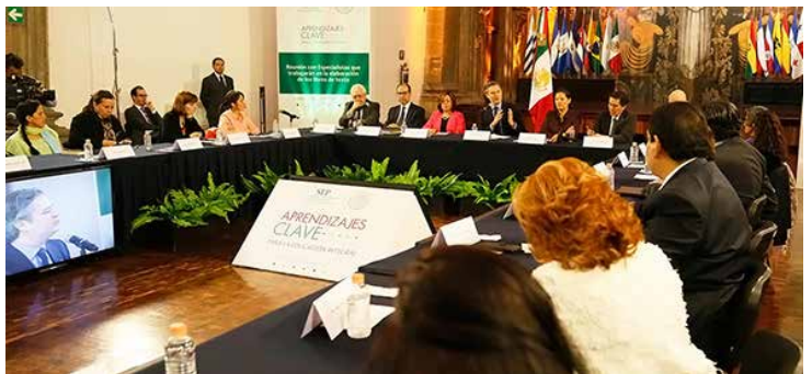
Renovación de textos implicará acercar nuevos materiales y recursos digitales