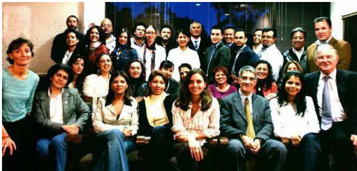
Primera generación del curso "La mejor práctica editorial".

Este seminario está dirigido a directivos y editores con experiencia profesional de cuatro a siete años y habilidad para proponer nuevas soluciones en diferentes escenarios; incluye también a quienes sean responsables de empresas editoriales de todos los rangos editoriales (micro o macro), especialidades (interés general, texto educativo, STM, infantil y juvenil, etc.) y soportes (impresos y digitales), mexicanas e internacionales con filiales locales. El cupo es limitado a 24 participantes.