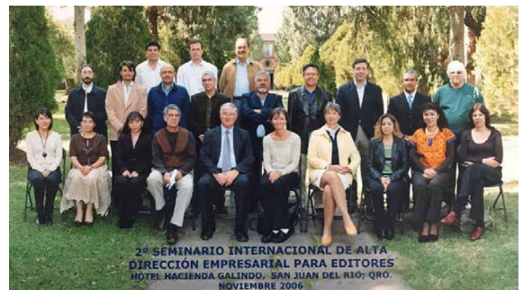
2º Seminario Internacional de Alta Dirección Empresarial para Editores, noviembre de 2006.