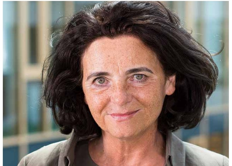
Sylvie Forbin, subdirectora general de la agencia de las Naciones Unidas para los Derechos de Autor y el Sector creativo.

Forbin describió la publicación como una guía para el logro de los objetivos de desarrollo de todos los países, indispensable para la erradicación del analfabetismo, cuya erradicación fue proclamada en 2016 como uno de los objetivos de Desarrollo sostenible clave de las Naciones Unidas. Como agencia de la ONU, la OMPÍ tiene la responsabilidad de ayudar a los países en desarrollo a reducir la brecha digital para que puedan participar plenamente en el comercio internacional de productos y servicios creativos. Para ello se debe basar en el marco del derecho de autor internacional.